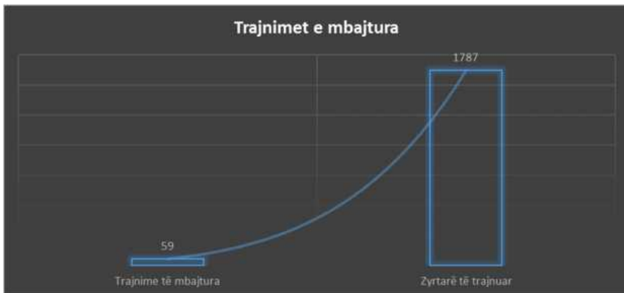
Figura 5: Organizimi i trajnimeve gjatë periudhës Janar-Dhjetor 2017.

Lidhur me forcimin e kapaciteteve profesionale dhe institucionale të komunave për të përmbushur kërkesat e qytetarëve dhe për të arritur përmirësim të qëndrueshëm në shërbimet komunale, ka realizuar këto aktivitete, si vijon: