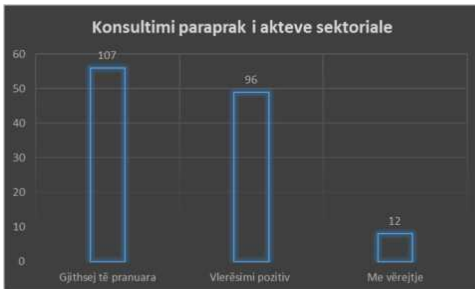
Figura: 3 Vlerësimi i përputhshmërisë së akteve sektoriale me legjislacionin për VQL.

Prej akteve të shqyrtuara në konsultim paraprak, 96 janë konstatuar se janë në përputhje me legjislacionin bazë për vetëqeverisje lokale, ndërsa janë dhënë komente për 11 akte të tjera, si vijon: