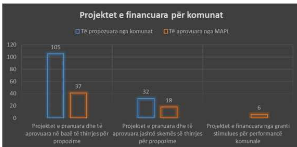
Figura 1: Të dhënat për projektet kapitale të financuara nga MAPL për komunat.

Me rastin e shpalljes së thirrjes për propozime, komunat kanë paraqitur 105 projekt-propozime për financim nga programi për projekte kapitale. Pas një procesi të shqyrtimit dhe vlerësimit të projekteve të komunave, komisioni vlerësues i MAPL-së ka përzgjedhur si të suksesshme 37 projekte të komunave, në kuadër të projekteve të pranuar jashtë skemës për thirrje janë pranuar 32 projekte dhe aprovuar 18. Ndërsa, në skemën e granteve për grantet stimulues janë aprovuar gjithsej 6 projekte. Në tërësi, gjatë vitit 2017 janë realizuar dhe implementuar 61 projekte në vlerën prej 3,490,336.63 euro. Në vijim është paraqitur skema e financimit të projekteve sipas dy formave të financimit: