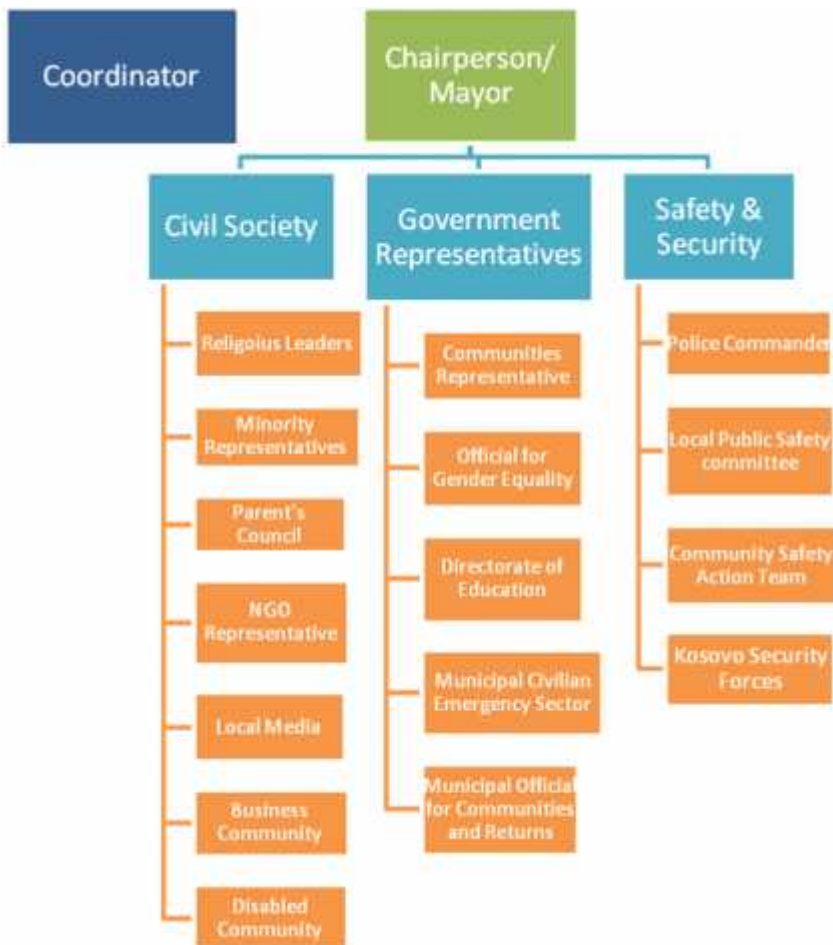
Fig.1. Organizativna struktura OSBZ-a.

U nastavku je predstavljena organizativna struktura OSBZ-a: