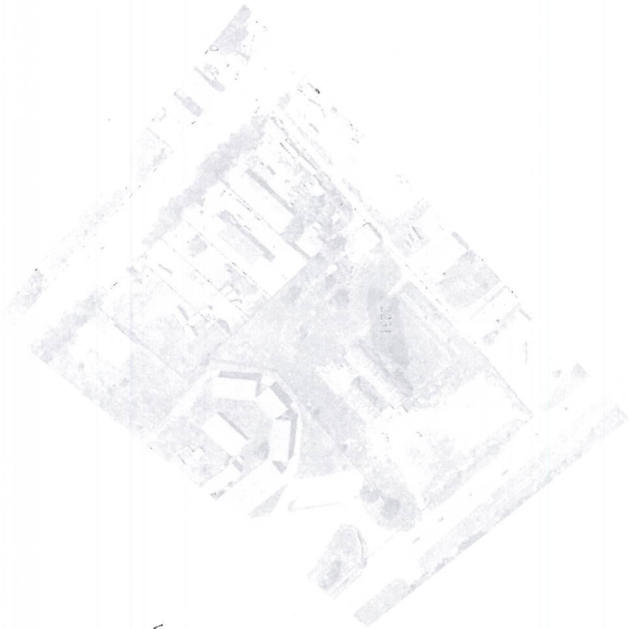
Vrejçe: Mungon pjesa grafike