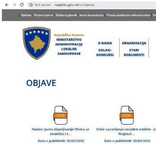
Slika 2: Virtuelna platforma za konsultacije Your Priorities za CYP ESMF