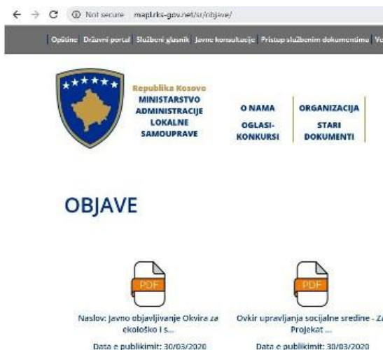
Slika 1: Objavljivanje ESMF i javni proglas na Internet stranici MALS

Virtuelne konsultacije su se odvijale između 31. marta i 9. aprila. U ovom periodu pristiglo je ukupno 41 pitanja/komentara putem platforme Vaši Prioriteti i e-maila. Većina dobijenih pitanja/komentara bili su zahtevi za pojašnjenje u vezi sa ciljanje projekta, njegovim aktivnostima i rokovima, na šta su odgovori bili dati na način naveden u tekstu iznad. Nije bilo pitanja/komentara o ekološkim i socijalnim uticajima ili o procesu pregleda i provere, gde bi se zahtevale izmene u ESMF. Kompletna lista komentara nalazi se u odeljku sa pitanjima i odgovorima u ovom aneksu.